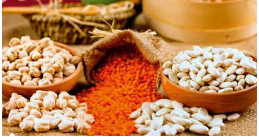
Tarım ve Orman Bakanlığı, bakliyat üretimini artırmaya yönelik planlamalar doğrultusunda kuru fasulye ve kırmızı mercimek tohumluğunun yüzde 75'ini hibe olarak üreticilere dağıttı.

Tarım ve Orman Bakanlığı, koronavi-rüs salgını sürecinde evde stoklanabildiği için yoğun talep gören kuru fasulye ve mercimek üretimini artırmak için harekete geçti. Bakanlık bünyesinde, stratejik ve fiyatı sık değişen tarım ürünlerinin takip edilmesi amacıyla kurulan Ürün Masaları tarafından, Covid-19'un bakliyat sektörüne etkilerine yönelik özel bir analiz hazırlandı. Analizde koronavirüs salgını karantina koşulları nedeniyle bakliyat ekim ve hasat sezonları göz önüne alındığında girdi ve işçilik temini, pazara erişim ile ürünlerin dış pazarlara ulaşımı gibi konularda sorunlar yaşandığı belirtildi. Analize göre bu ürünlere talepteki ani yükseliş, uluslararası piyasalarda fiyatları artırırken, ülkeler iç piyasada yeterliliğin ve fiyat istikrarının sağlanabilmesi için ihracatı durdurma, ithalat vergilerinin sıfırlanması gibi önlemlere başvurdu. Dünya genelinde pandeminin talep artışına neden olması ve arzda ortaya çıkardığı sorunlar nedeniyle fiyat artışlarının devam edeceği öngörüldü. Yurt içi piyasalarda arz talep dengesi açısından üretime ve ihracata yönelik tedbirlerin alınması gerektiği bildirildi