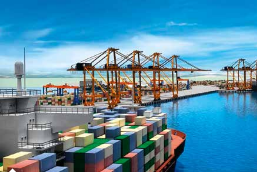
Covid-19 salgınına karşı alınan tedbirler kapsamında Mersin Limanı'na giriş yapan gemilerin sadece köprü üstü değil, yaşam mahallerinin de dezenfekte edilmesi zorunlu hale getirildi.

alınan önleyici tedbirlere ek olarak, bölgemizin temel ihtiyaçlarının karşılanması ve ticaretinin aksamaması adına Mersin Limanımızda da ilave önlemler hızlı şekilde alınmakta, liman kullanıcılarının bu süreçteki sıkıntılarına yönelik kolaylaştırıcı tedbirler uygulanmaktadır.