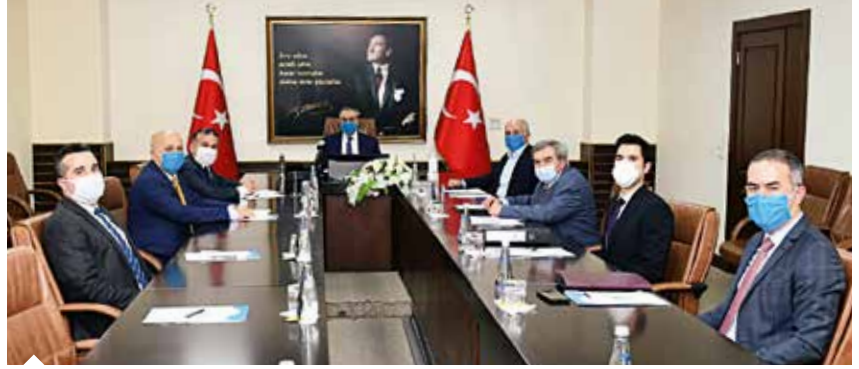
Toplam 2 milyon 989 bin bütçeli olarak planlanan Lojistik Mesleki Eğitim Merkezi Projesi'nin destekleme protokolü Mersin Valisi Ali İhsan Su'nun başkanlığındaki toplantıda imzalandı.

Lojistik Eğitim Merkezi'nin 19-29 yaş arasındaki gençlere mesleki eğitim vereceğini belirten ÇKA Genel Sekreteri Dr. Lutfi Altunsu "150 metrekare alan üzerinde bir adet mesleki eğitim simülasyonunu olacağı merkezde, genel eğitim sınıfları, mesleki eğitim kursları, kurumsal kapasite artırma hizmetleri, mesleki yeterlilik sınav ve belgelendirme hizmetleri ile merkezin gelişimine yönelik, eğitimcinin eğitimi, ulusal ve uluslararası network ağlarına