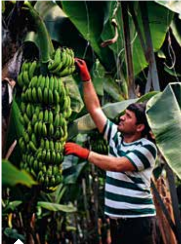
Yeşil olarak hasat edilen muzlar, daha sonra sarartma işlemine tabi tutuluyor.