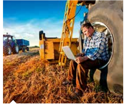
Üreticiler, Dijital Tarım Pazarı portalı üzerinden ürünlerini pazarlayabilecekler.

DİTAP ile Türkiye'nin imkanlarının en iyi şekilde değerlendirileceğini vurgulayan Pakdemirli, "Bu kapsamda, Sözleşmeli Tarım Platformu ile üreticileri, kooperatifleri, birlikleri, sanayicileri, halcileri, tüketim sektörünü, tarım danışmanlarını, bankaları, sigortacıları ve diğer tüm paydaşları bir araya getireceğiz." diye konuştu. Pakdemirli, DİTAP'ın ürününü değer fiyattan satarak kazancını artırmak isteyen üretici ile kaliteli ürünü daha uygun fiyatlara almak