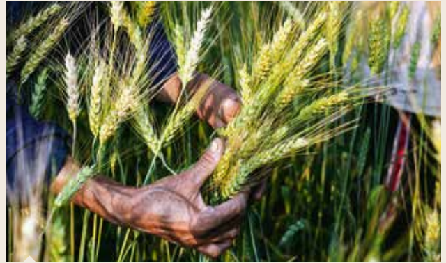
Toprak Mahsulleri Ofisi, makarnalık buğday ekim alanlarında geçen yıla göre yüzde 10'luk artış olduğunu belirtti.

Bakliyatla ise nohut ekilişleri Güneydoğu Anadolu Bölgesi'nde tamamlanırken, bu bölgede geçen yıla göre yüzde 20-25 artış tahmin ediliyor. İç Anadolu Bölgesi'nde ise devam eden ekilişlerin geçen yıla benzer seyir izleyeceği öngörülmüyor. Yeşil