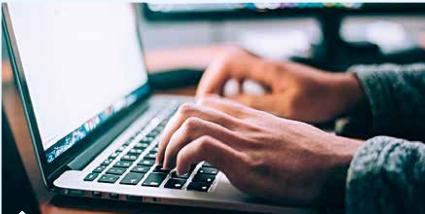
Kalkınma Kütüphanesi'nde yurt genelindeki 26 kalkınma ajansının çalışmaları paylaşımına açıldı.

Kalkınma Ajansları Genel Müdürlüğü'nce oluşturulan ve "www.kalkinmakutuphanesi.gov.tr" adresi üzerinden ulaşılabilen platformda, bölgesel plan ve programlar, sektörel analiz raporları, proje fizibilite raporları, etki analizleri ve diğer bir çok türde yayına yer verildi.