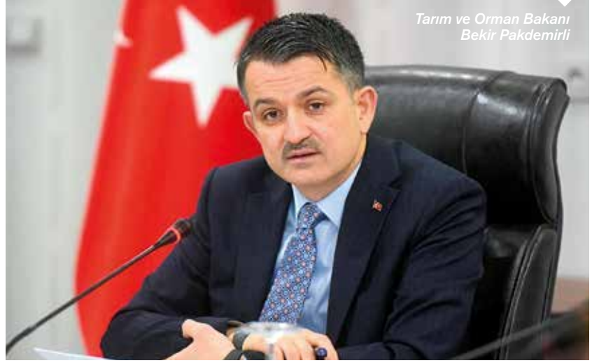
Tarım ve Orman Bakanı Bekir Pakdemirli