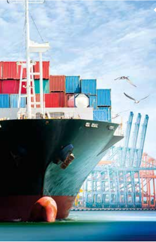
Mersin Limanı'nda 2020 yılının ilk çeyreğinde 1032 gemi işlem gördü.

kontrol eden ve kritik hammaddelerin ticaretinde önemli rol oynayan, bu itibarla küresel ekonominin ve dünya deniz ticaretinin baş aktörlerinden biri sayılan Çin, salgından ilk etkilenen ülkedir. En büyük ihracatçı konumundaki bu ülkenin son 10 yıldır büyüme oranı yüzde 6'nın altına düşmemiş iken, IMF 2020 yılı için Çin'in büyüme oranını 1,4 olarak tahmin ettiğini açıklamıştır. Benzer durum dünya ticaretinde söz sahibi olan gelişmiş ve gelişmekte olan ülkeler için de geçerli olacaktır.