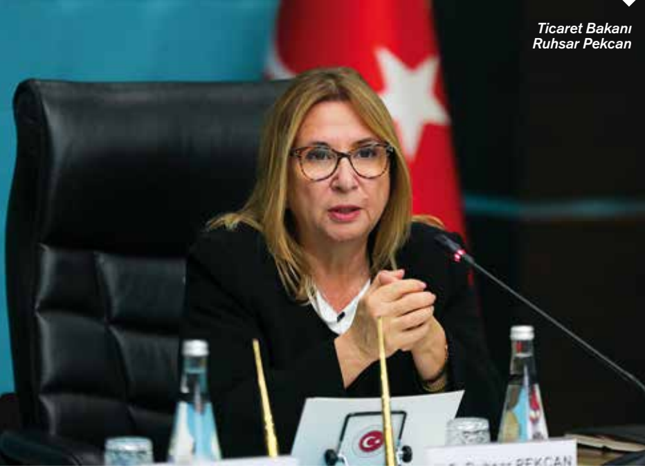
Ticaret Bakanı Ruhsar Pekcan